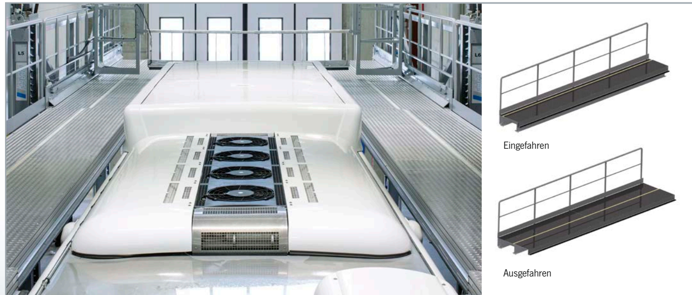
Ausschubelemente: Einzelsegmente von 3 bis 9 Meter Länge.