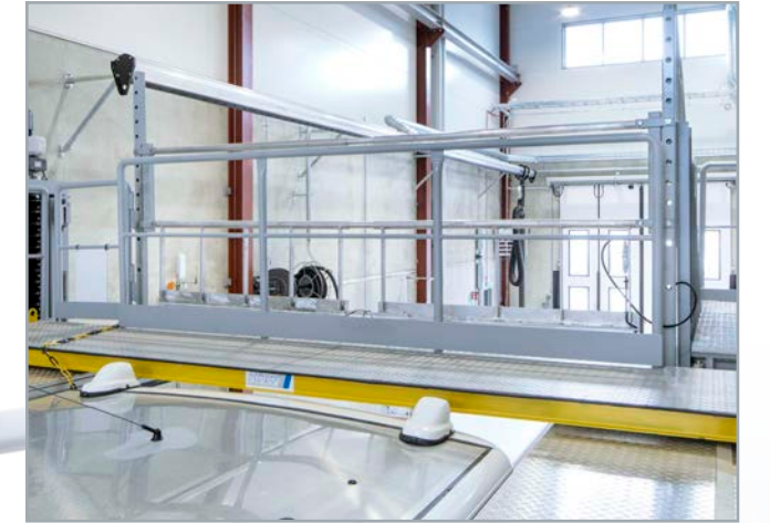
Schutzeinrichtung an den Bühnenenden: Anpassbar an die Länge der Busse.

Ein weiterer wichtiger Effekt der Sicherheitsmaßnahmen: Durch die kurzen Rüstzeiten sind die Fahrzeuge wieder schneller betriebsbereit.