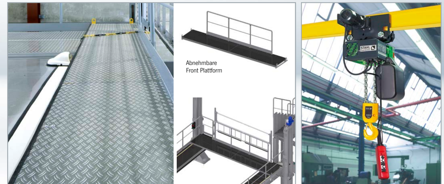
Abnehmbare Front Plattform: Der Mitarbeiter ist auch bei der Wartung von Front und Fahrzeugheck gesichert.